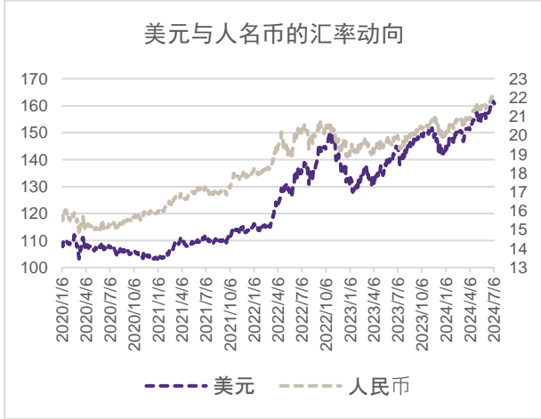
外币 (来源: Mizuho Bank 发表的外币汇率)