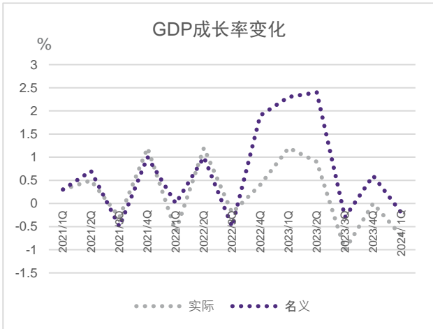
GDP 成长率