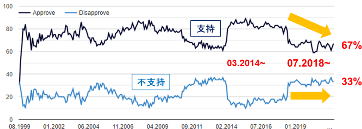
（図表1）プーチン支持率の低下、不支持の高止まり （59% [2017年8月] が 23% [20年夏] まで低下という見方も）

その背景には、政権支持率の著しい低下がある。レバダセンター調査によれば、プーチンへの支持率はこの3、4年で急減した。二者択一式の公式世論調査に複数回答式の追加的なオープン世論調査を加味した推定支持率は、2017年8月に59%だったのが、2020年夏には23%まで落ちて盤石だった支持基盤は崩れつつある（図表1）。